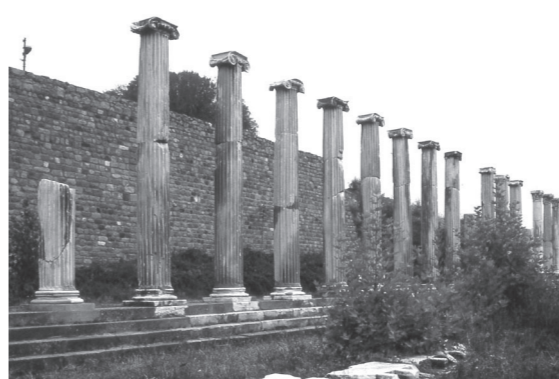
ギリシャのアスクレピオスの医学学校の跡