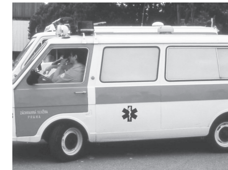
ギリシャの救急車