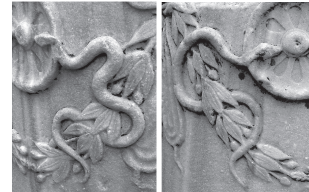
アスクレピオスの大理石に描かれた蛇