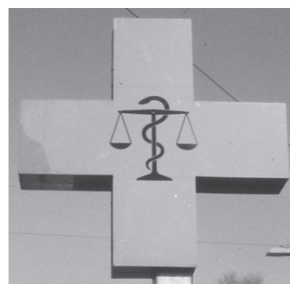
ベルン(スイス)の薬局のシンボル