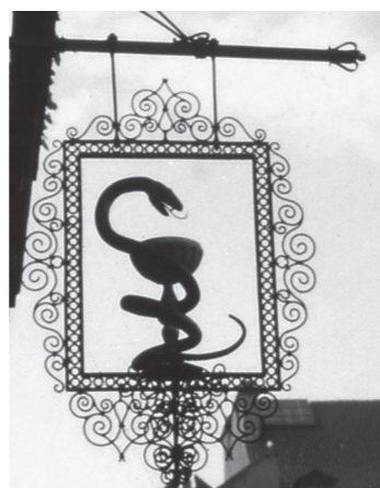
ワルシャワにある薬局の看板