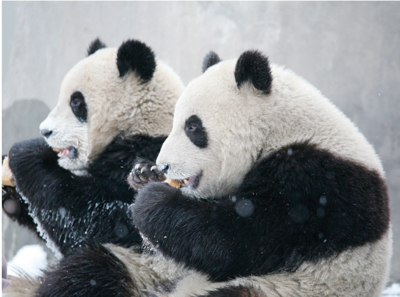
四川省臥龍パンダ保護研究センターでの取材は小雪の中行われた。2008