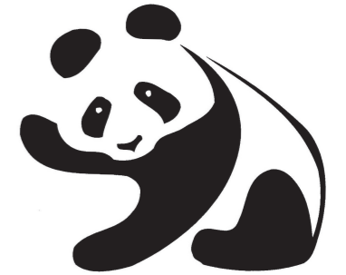
製靴 イギリス F.H.K Henrion 1948